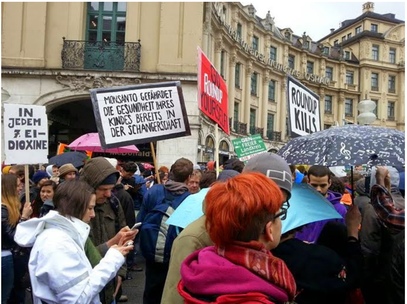
Manifestantes marchando pelas ruas de Munique, Alemanha, exigindo a proibição dos OGM