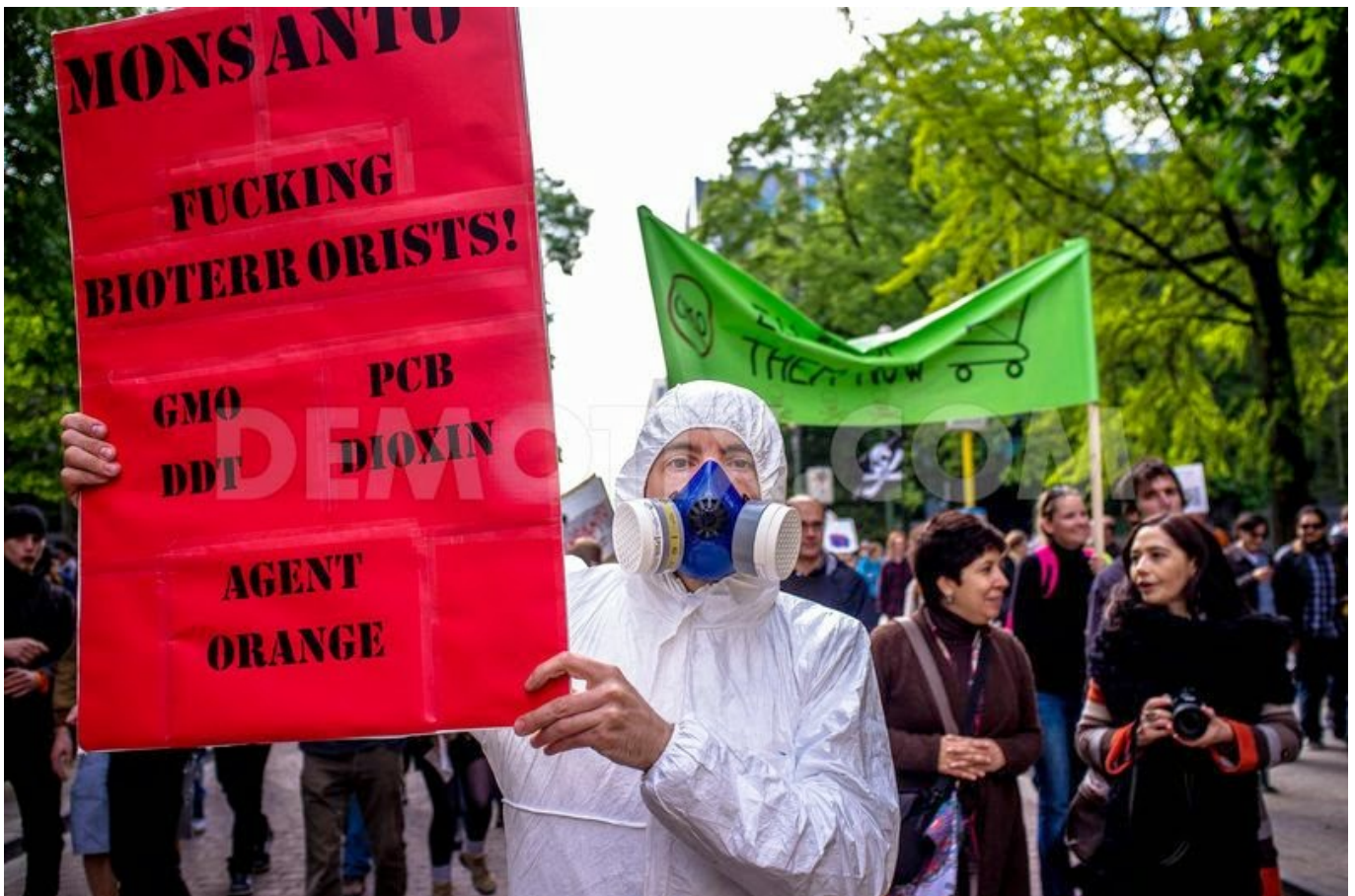
Manifestante passa a mensagem contra a Monsanto, em Bruxelas, Bélgica

A luta concertada chegou também ao continente africano, que se juntou em 2011 ao combate da proliferação transgénica que ameaça a multiplicidade da herança natural – foi criada a Aliança para a Soberania Alimentar em África, constituída por grupos de pastores, pescadores, povos indígenas, organizações ecologistas (como a Amigos da Terra África) com o intento de mobilizar a expressividade da agricultura e das pescas, buscando soluções comunitárias que façam frente aos interesses corporativos que assolam a liberdade e integridade dos povos. Na Europa, vários têm sido os países a alinharem contra a predominância dos OGM: na Bulgária, Luxemburgo, Hungria e Grécia o cultivo e a venda de transgénicos foram totalmente banidos pela legislação nacional; na Hungria, mil hectares foram destruídos, em 2011, depois de encontrados campos de cultivo de milho geneticamente modificado.