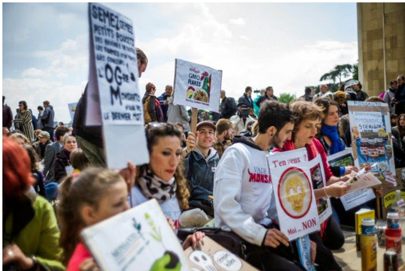
Activistas anti-OGM reunidos na praça Trocadero, perto da Torre Eiffel, durante a manifestação contra os OGM e a gigante Monsanto, no dia 25 de Maio em Paris