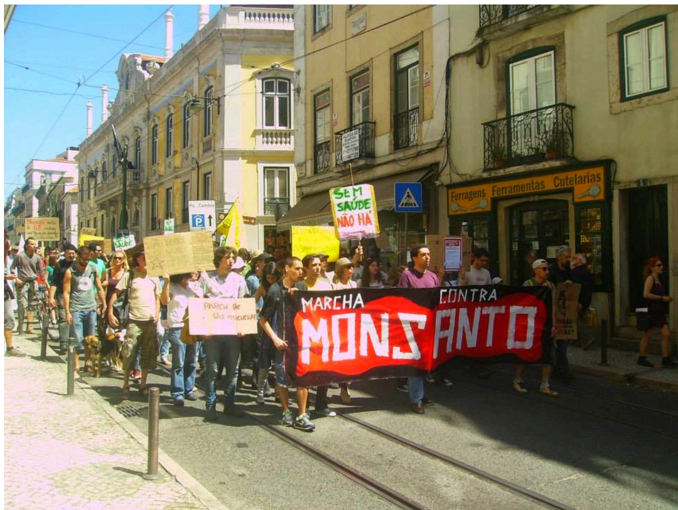
Marcha Contra Monsanto em Lisboa

O dia 25 de Maio de 2013 viu o mundo dar um cartão vermelho total à gigante multinacional Monsanto. O protesto, espalhado por dezenas de países e centenas de cidades à volta do globo, é um marco na luta internacional contra a privatização da Natureza e a favor da preservação da biodiversidade. Marchando, em rota de colisão com o poder corporativo, os cidadãos mostraram a sua indignação perante a monopolização do mercado das sementes e o perigo latente e ainda misterioso dos alimentos geneticamente modificados. A falta de supervisão científica, a notória promiscuidade entre governos e empresas do ramo da biotecnologia e a gritante falta de informação quanto aos malefícios dos produtos transgénicos foram razões mais que suficientes para o povo, um pouco por todo o planeta, se agregar em torno daquilo que é de todos por direito: a liberdade do processo alimentar e a integridade biológica das culturas agrícolas. O movimento «March Against Monsanto» visou consciencializar as populações para o perigo global em que vai sendo transformada a comida, autêntica refeição de destruição maciça, nas mãos de empresas que apenas perseguem o lucro de modo cego e avassalador.