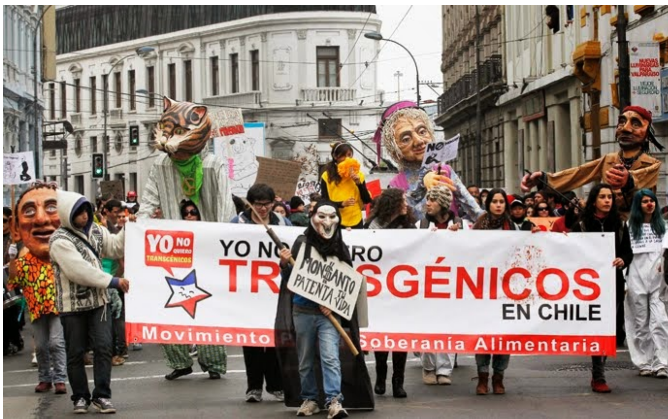
Manifestantes seguram cartazes durante um comício contra a Monsanto e os organismos geneticamente modificados, em Valparaíso, Chile