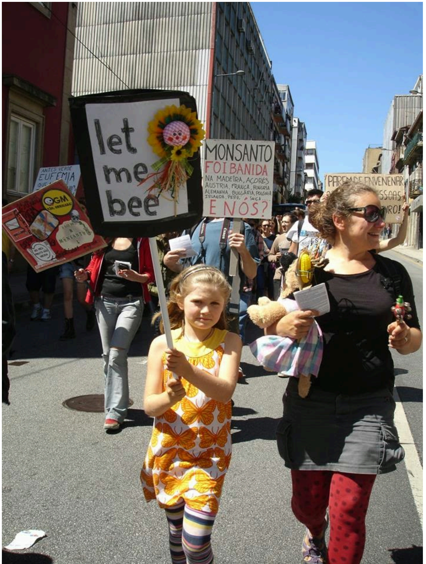
Protesto contra a Monsanto no Porto