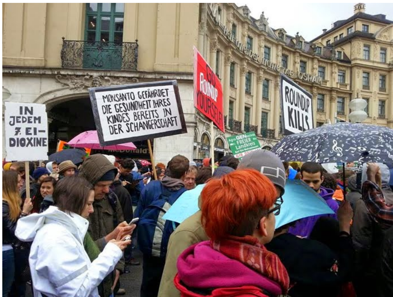
Manifestantes marchando pelas ruas de Munique, Alemanha, exigindo a proibição dos OGM