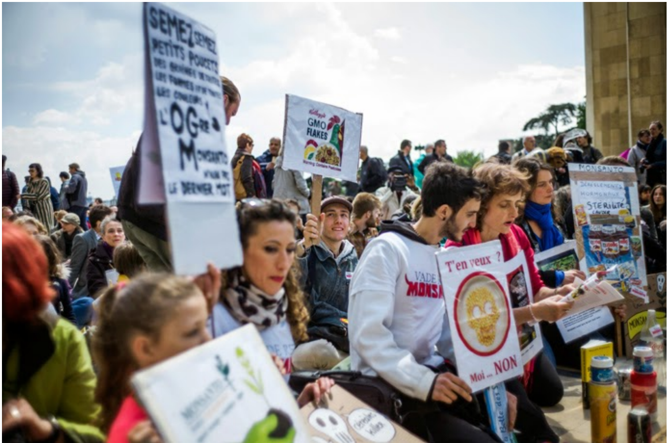
Activistas anti-OGM reunidos na praça Trocadero, perto da Torre Eiffel, durante a manifestação contra os OGM e a gigante Monsanto, no dia 25 de Maio em Paris