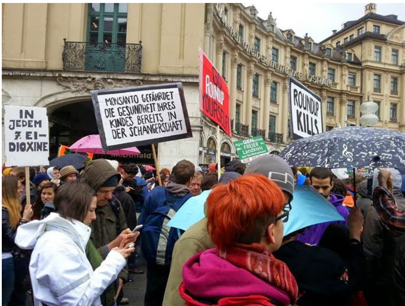
Manifestantes marchando pelas ruas de Munique, Alemanha, exigindo a proibição dos OGM