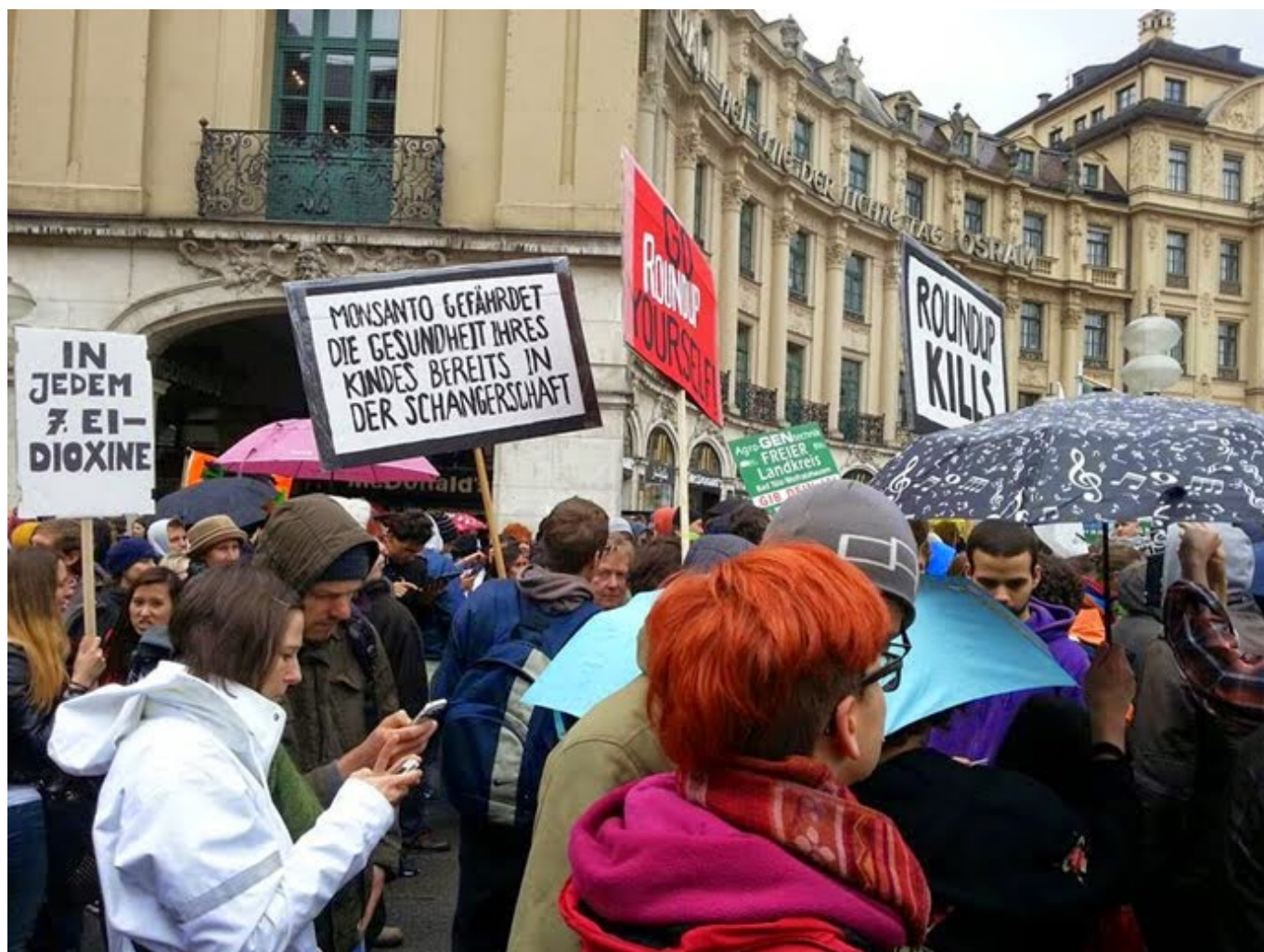
Manifestantes marchando pelas ruas de Munique, Alemanha, exigindo a proibição dos OGM